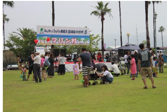
当日開催された 第9回マリン村の様子

※「みなとオアシス」とは、地域住民の交流や観光の振興を通じた地域活性化に資する「みなと」を核としたまちづくりを促進するため、住民参加による地域振興の取組みが継続的に行われる施設として国土交通省が申請に基づき登録する制度です。