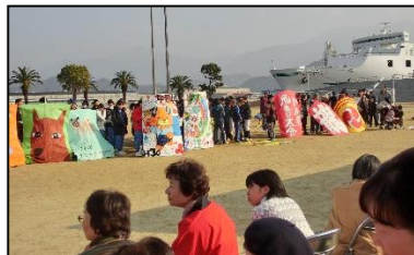
新居浜凧上げ大会