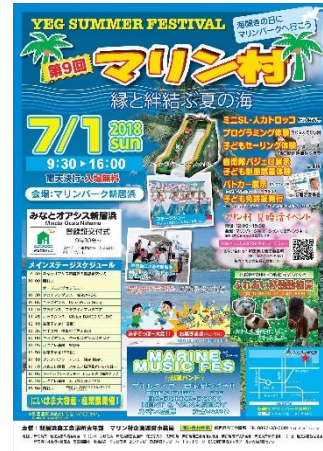
第9回マリン村のチラシ