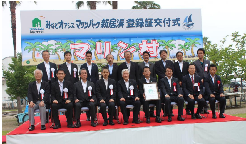
登録証交付式関係者による記念撮影