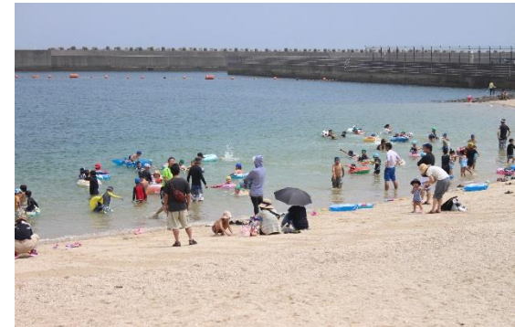
海開きとなった人工海浜 (通称：ヤシの木ビーチで泳ぐ来場者)

・マリン村HP： http://www.niicci.or.jp/latest_information/201806013635/